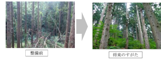
～多様な樹齢からなる森林が面的に整備され、公益的機能が持続的に発揮される森林へ～