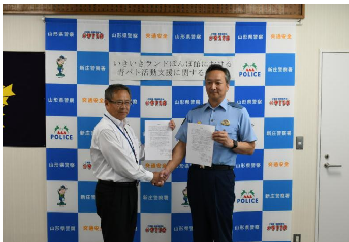
サービス利用にかかる調印式

この機会にサービスを積極的に活用し、青パト活動の疲れを温泉施設で解消しましょう。