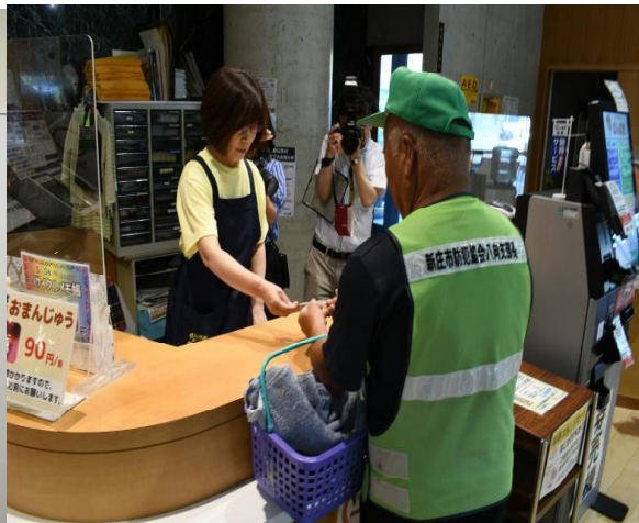
サービス利用状況