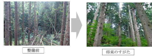
～多様な樹齢からなる森林が面的に整備され、公益的機能が持続的に発揮される森林へ～