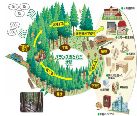
健全な森林のサイクル