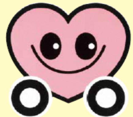
山形県交通安全シンボルマーク