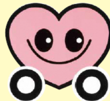
山形県交通安全シンボルマーク