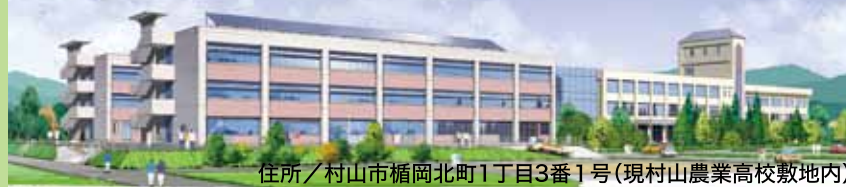
住所/村山市榎岡北町1丁目3番1号(現村山農業高校敷地内)