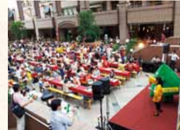
「恵比寿ガーデンプレイス」でのつや姫レディとペロリンによるつや姫PR

「恵比寿ガーデンプレイス」でのイベントなどを通して、月に全国販売が開始される「つや姫」のPRを行いました。会場にお越しいただいたお客様から「つや姫はおいしいね!」とのお声掛けをたくさんいただき、「つや姫」の良さが着実に首都圏の方々に広がってきている手応えを実感しています。