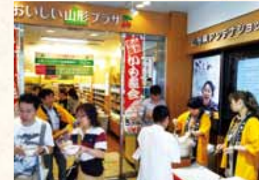
「おいしい山形プラザ」で、山形の秋の風物詩「芋煮鍋」の振舞い

問い合わせ ◎東京事務所 千代田区平河町2-6-3 都道府県会館13階 ☎03-5212-9026