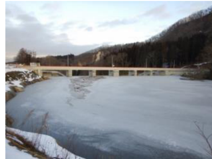
試験湛水状況 満水 (R2. 1. 14)