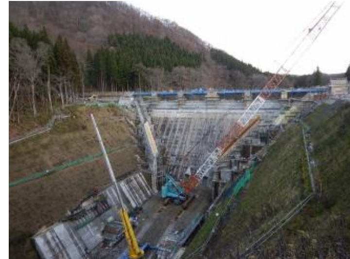
天端橋梁架設完了 (H30. 12)