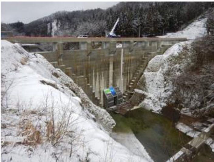
試験湛水状況 貯水前 (R1. 12. 27)