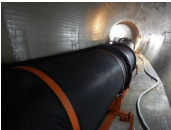
維持放流管据付(1本) (R1. 8)