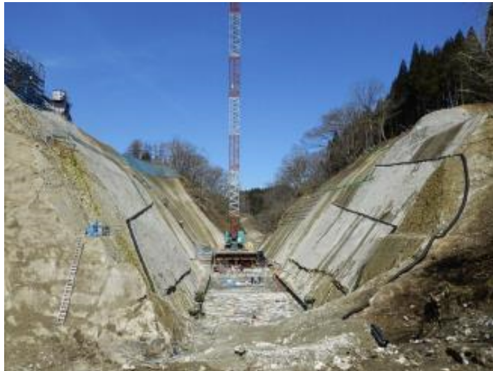
基礎掘削完了、堤体打設開始 (H29. 4)