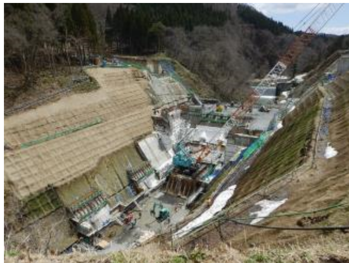
ダム堤体工事状況 (H30. 4)