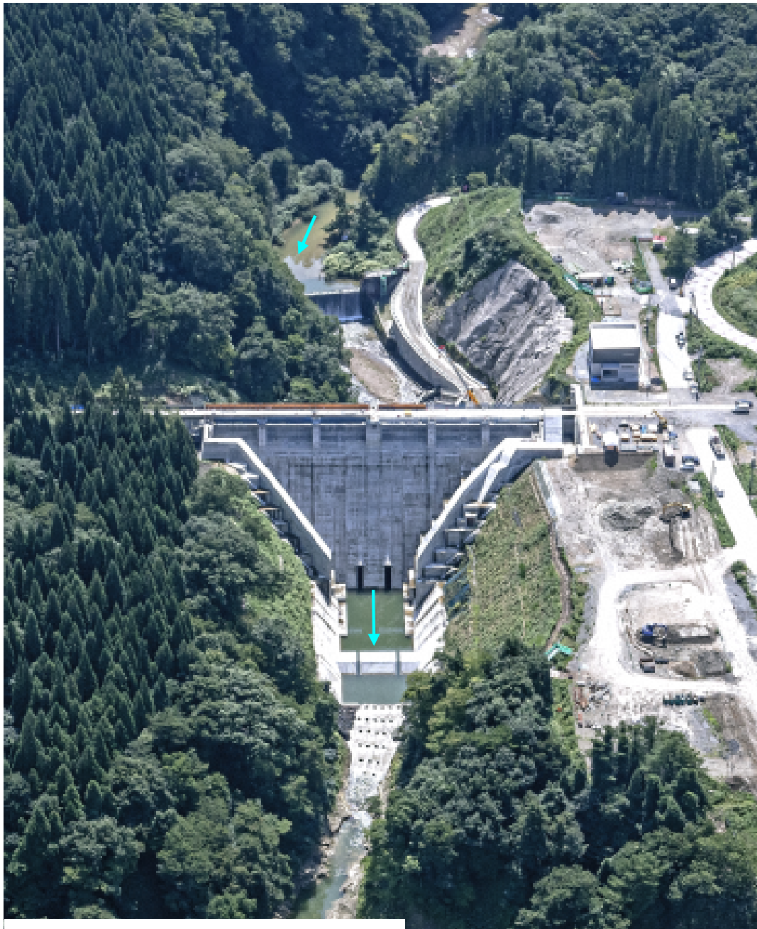
(撮影 R1. 8月)