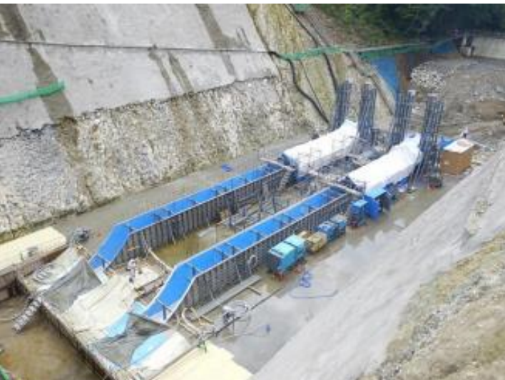
放流設備据付(2門) (H29. 7)