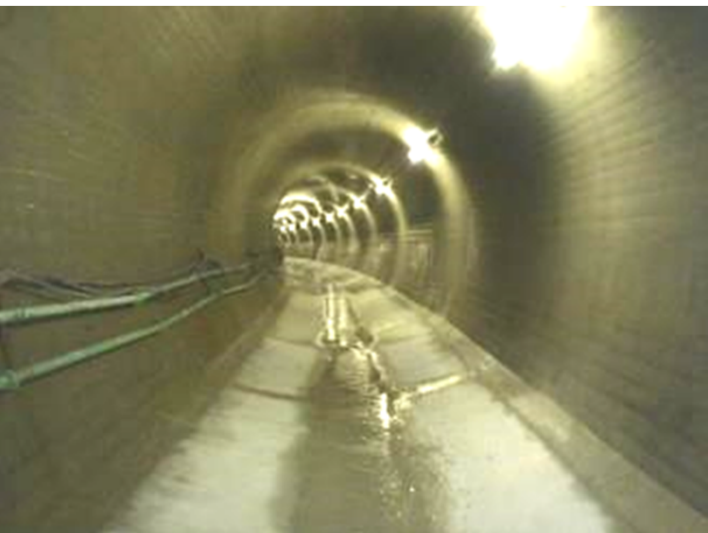
仮排水路(トンネル) H28転流開始