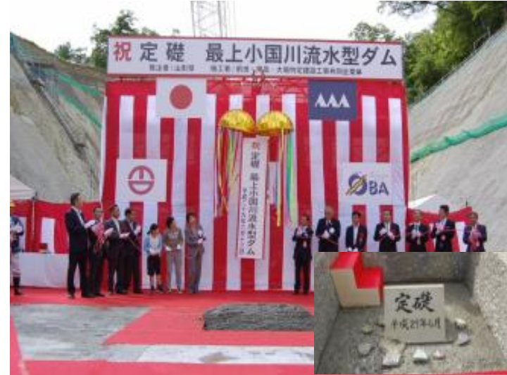
定礎式(H29. 6. 13)