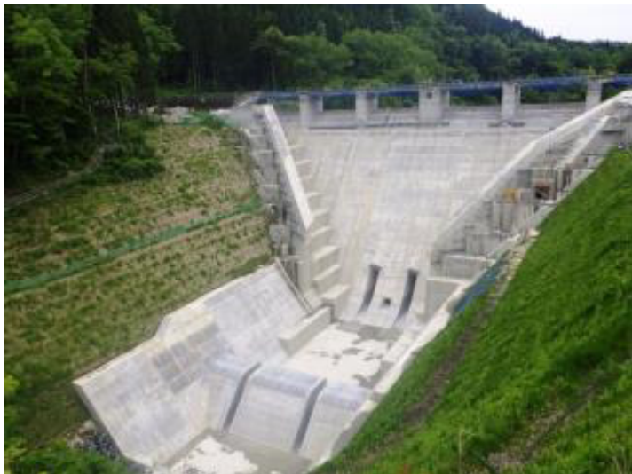
ダム本体(下流) R1. 7転流終了前