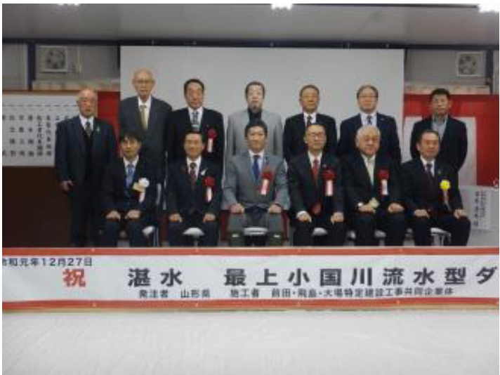
湛水式 (R1. 12. 27)