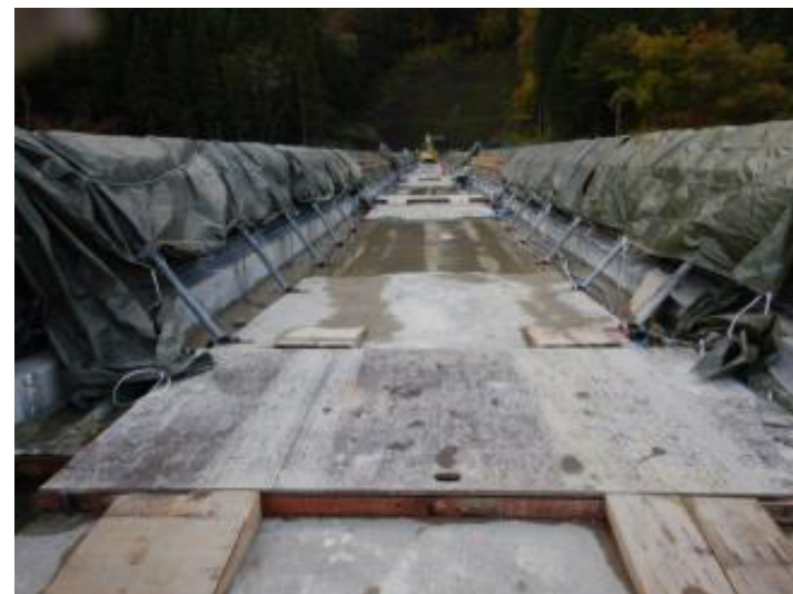
天端橋梁地覆施工状況 (R1. 10)