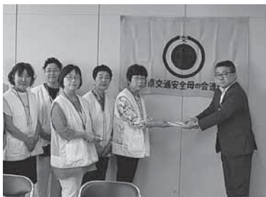
寒河江地区交通安全母の会 様 より