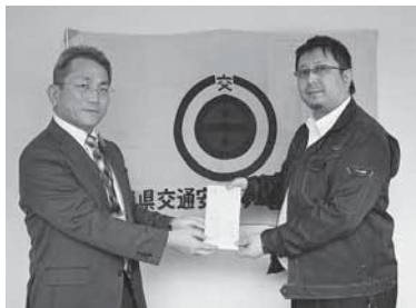
のみしん倶楽部Z 様 より