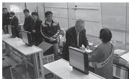
山形県中古自動車販売協会 様 より