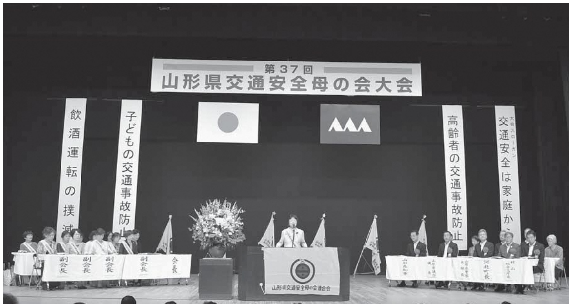
第37回山形県交通安全母の会大会（河北町サハトベに花）