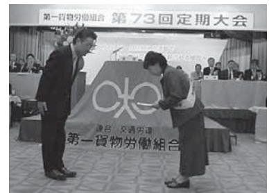
第一貨物労働組合 様 より