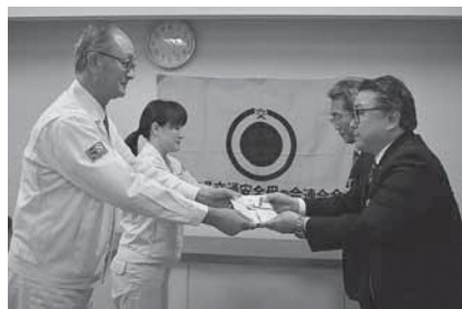
ミクロン精密株式会社 様、 ミクロン精密株式会社 輪の会 様 より