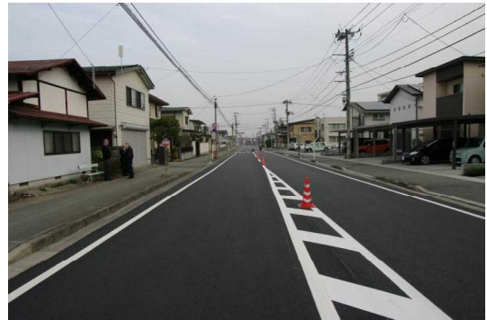
【Aの進路方向（日中）から見た現場の状況】