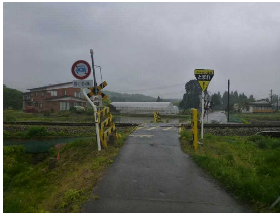
【Aの進行方向から見た現場の状況】