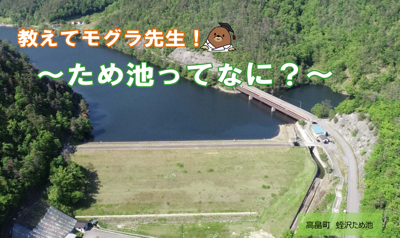
高畠町 蛭沢ため池