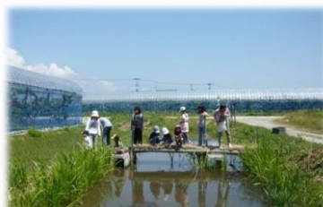
めだかの学校本校舎