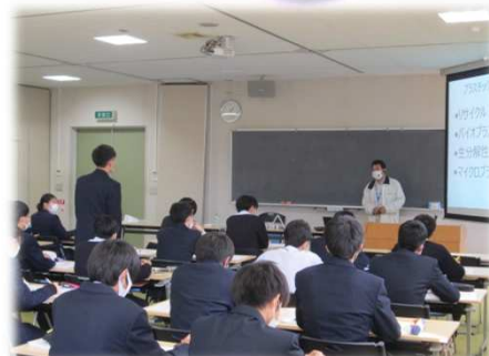
写真：九里学園高等学校（米沢市）での学習会