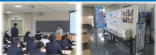
写真：若者向けSDGs学習会(左)、県庁ロビーでの展示紹介(右)