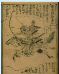
かまくらごんごろうかげまさ 鎌倉権五郎景政