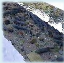
ふるさとへ遡上した鮭