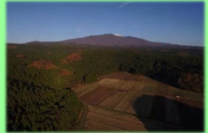
牛渡川へ伏流水をもたらす鳥海山