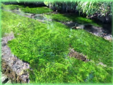
牛渡川に生えるバイカモ