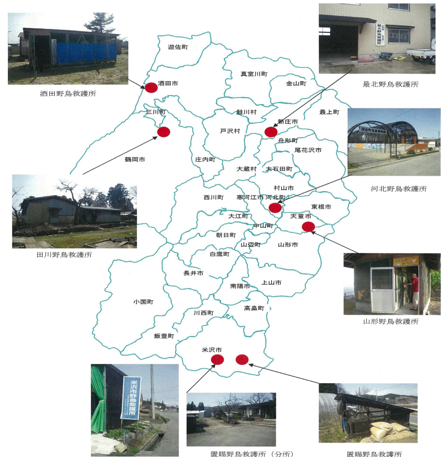
県内救護所位置図