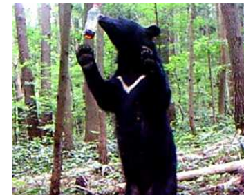
カメラトラップ調査状況