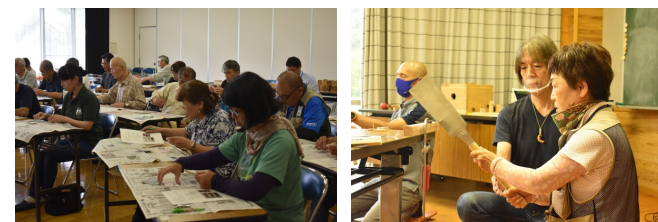
研修会のイメージ

【事業効果】 やまがた木育を通して「森からの恩恵を受けるのみではなく、一人ひとりが森と共に生きていることや、木を活かす暮らしの大切さを改めて理解し、行動を起こすことができる人」が生まれ、森づくり参加者の増加や山形の森や木に対する愛着が生まれることにより、県民の森林等に対する理解や豊かな緑を育む意識の醸成を図ることができる。