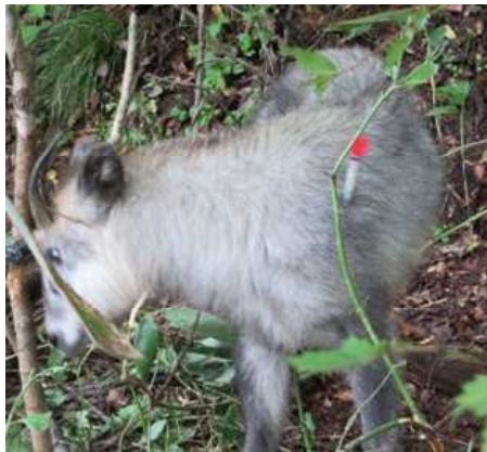
○保護された野生鳥獣（カモシカ）の状況