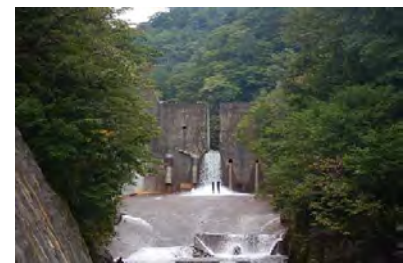
既設えん堤スリット化 (令和2年4月)

整備率 (%) = \frac{\text{施設効果量}}{\text{流出するおそれのある土砂量}} ● 流出するおそれのある土砂量 : 639,900m 3 ● 施設効果量 (砂防えん堤工) : 458,200m 3 整備前 26 (%) = 165,700m 3 /639,900m 3 ▶ 現況 32 (%) = 204,400m 3 /639,900m 3 整備後 72 (%) = 458,200m 3 /639,900m 3