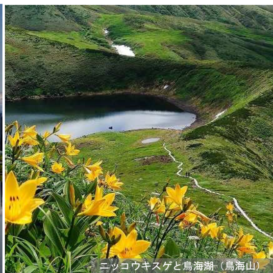
ニッコウキスゲと鳥海湖（鳥海山）