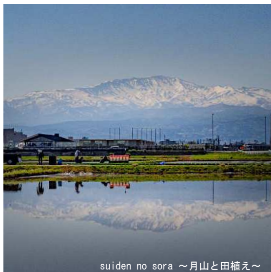
suiden no sora ~月山と田植え~