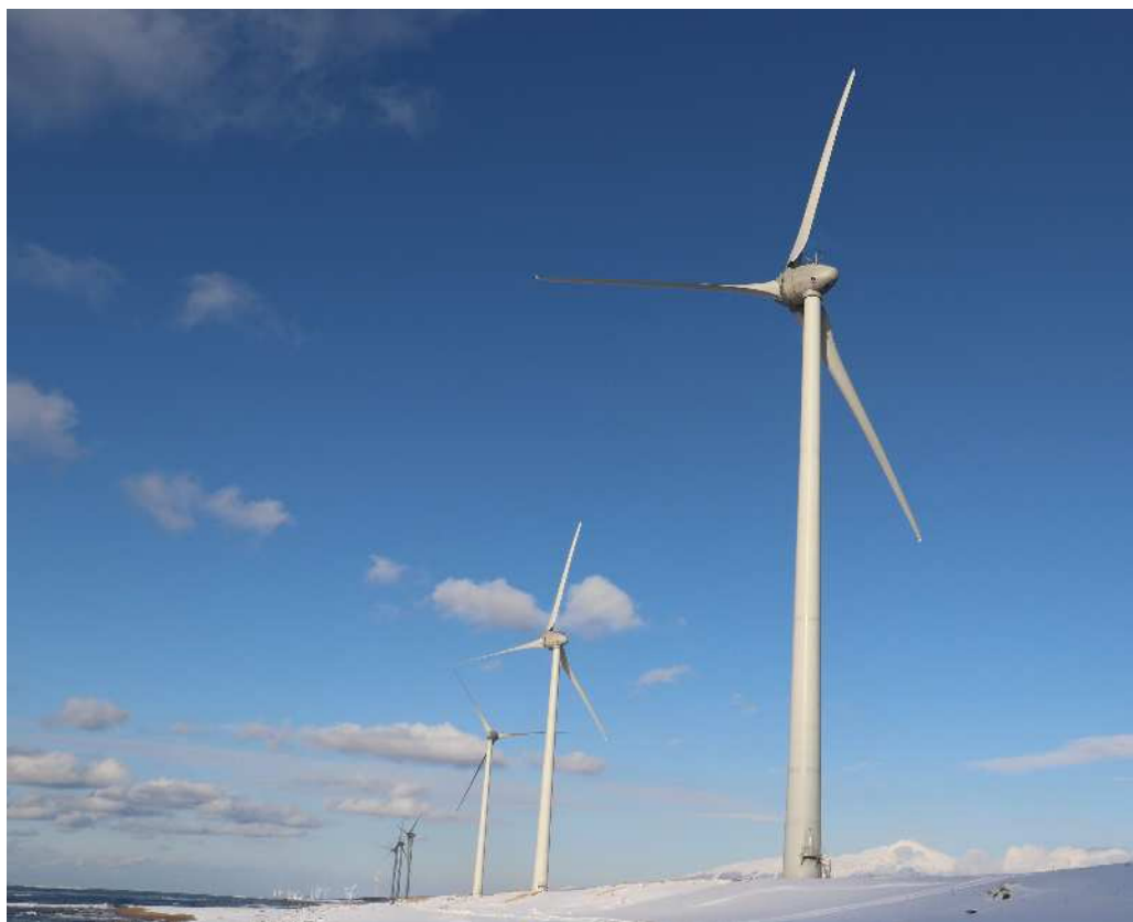
県営酒田風力発電所（山形県酒田市）（令和3年4月運転開始）