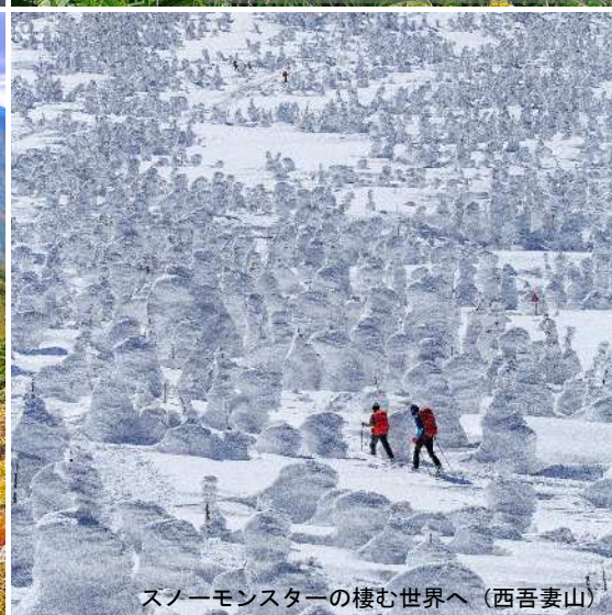
スノーモンスターの棲む世界へ（西吾妻山）

第6回「山の日」全国大会（令和4年8月 山形県開催予定） （令和2年度やまがた百名山 Instagram フォトコンテスト）