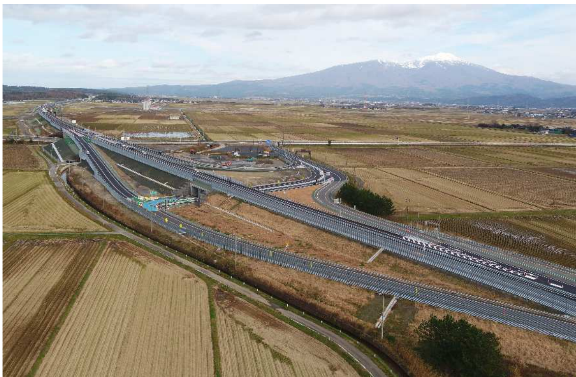
ゆぎひこ 日本海沿岸東北自動車道「酒田みなとIC～遊佐比子IC」間開通（令和2年12月13日）