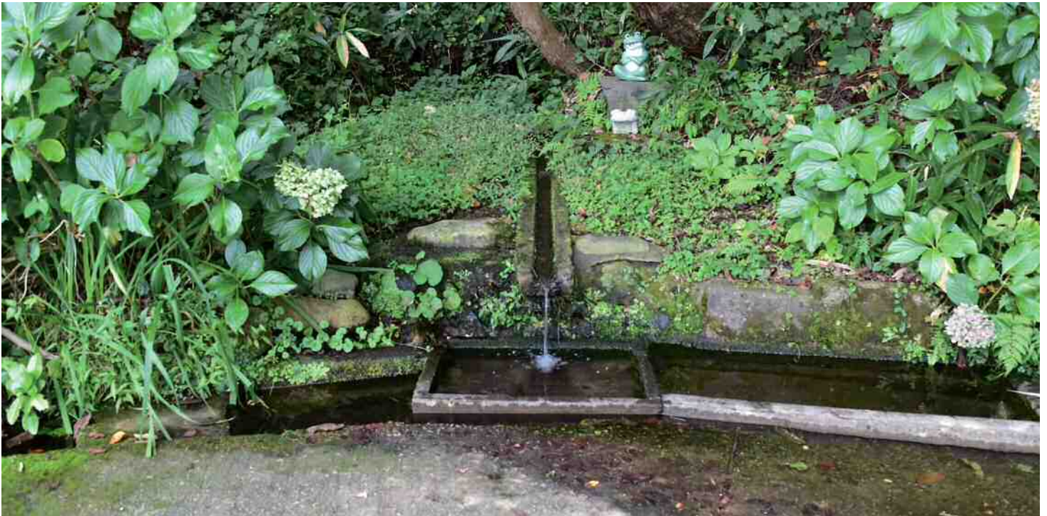
〔管理者〕 驹笼地区 〔维护单位〕 驹笼地区会