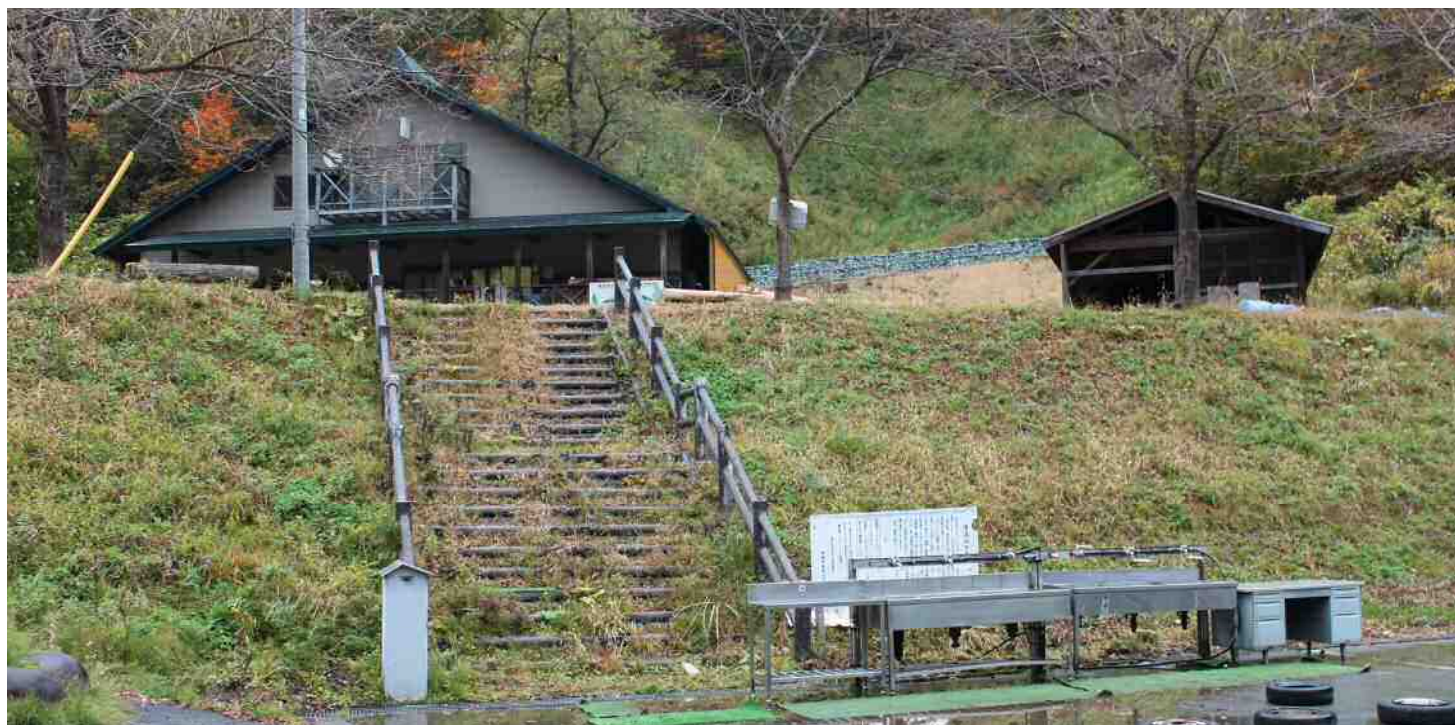
〔管理者・维护单位〕樽石大学