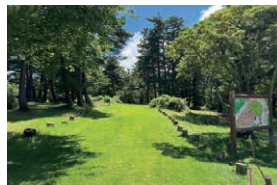
蔵王坊平国設野営場