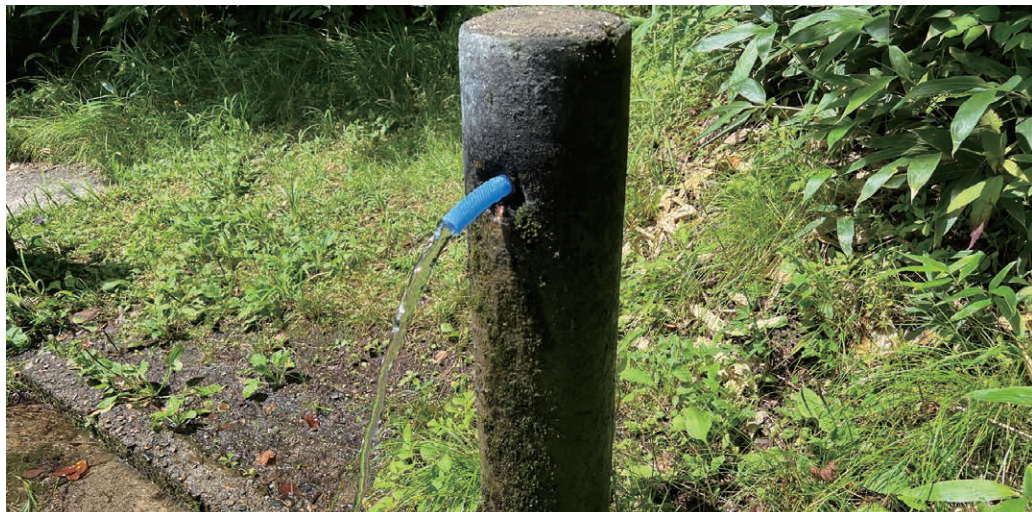
〔管理者〕上山市 〔保全体〕蔵王坊平観光協議会