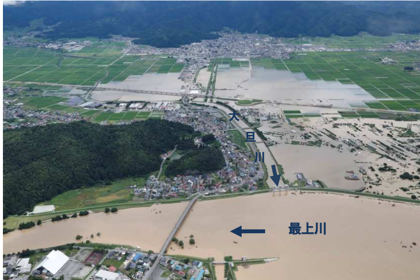
一級河川大旦川（令和2年7月浸水被害状況）