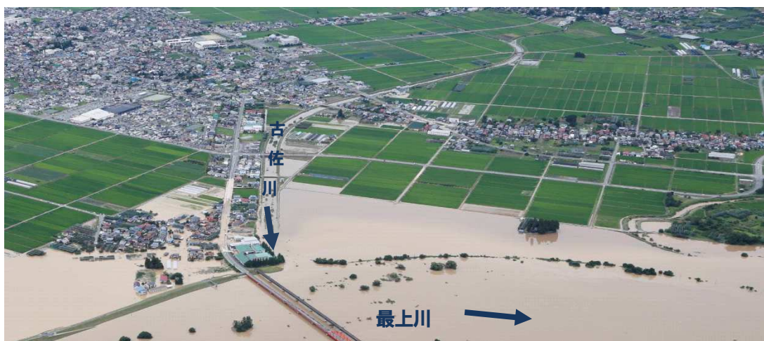
一級河川古佐川（令和2年7月浸水被害状況）

また、これまでの治水や利水だけでなく、良好な環境の整備や保全についての要望が年々高まっており、県内の各河川において生態系や景観などに配慮した川づくりにも努めている。