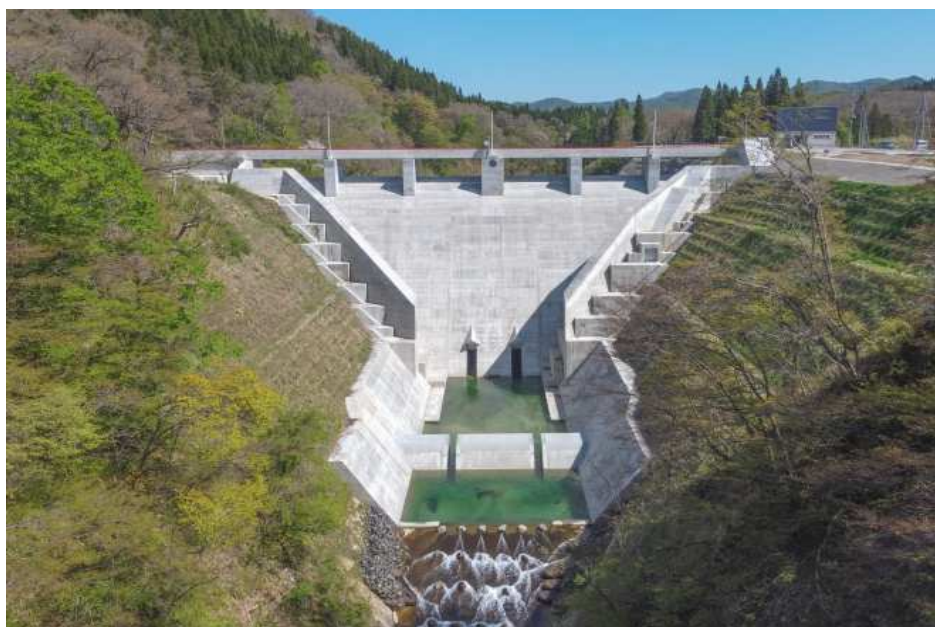
最上小国川流水型ダム（令和2年3月竣工）

また、平成20年度に最上小国川流水型ダム（最上町）の建設事業に着手し、令和元年度に完成した。