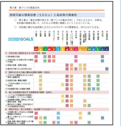
各政策とSDGsとの関連性を整理 (第4次山形県総合発展計画より)