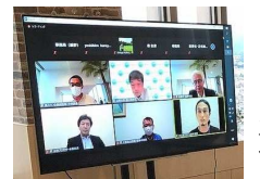
オンラインセミナーの様子