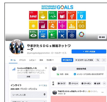
「やまがたSDGs推進ネットワーク」フェイスブック