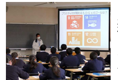
県内高校での環境学習会