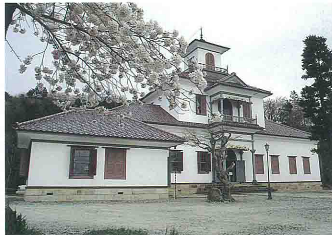
旧東村山郡役所資料館

明治12年に建てられた洋風館。明治14年には、明治天皇御巡幸の際に行在所として使用された。アーチ型のステンドグラスからは色鮮やかな光が放たれ、今なお文明開化の華やかさをとどめている。天童の歴史、人々の喜びなど、数々の思い出を刻む大切な明治時代の遺産。県指定文化財。