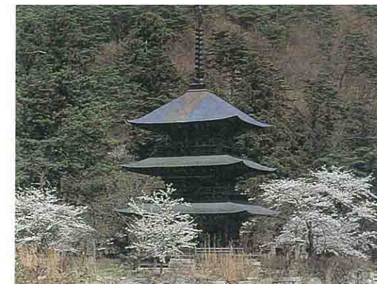
安久津八幡神社三重塔