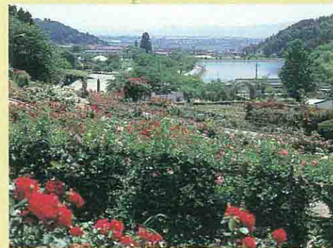
東沢公園・バラ園

バラ園には、500品種、15,000株の世界各国のバラが咲き、東日本一を誇る。見頃は6月上旬から9月中旬までである。また、東沢湖では、チョウサメが飼育されており、卵は世界三大珍味の一つ「キャビア」である。