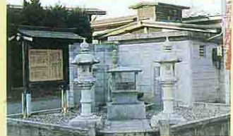
黒沢温泉 湯あみ観音

田圃と果樹園に囲まれた静かな温泉。6~7月にはさくらんぼ狩りが楽しめる。泉質は芒硝泉でリウマチや高血圧などに効果があると言われています。近くの「やんめ不動尊」は斎藤茂吉の歌集にも紹介されており、茂吉の生家、記念館めぐりの基地としても便利です。