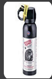
クマ撃退スプレー