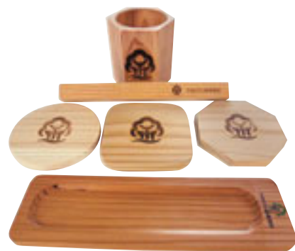
ペン立て・マグネット・コースター・ペン皿 「山形県間伐材製品セット」

☆正解者の中から、「山形県間伐材製品セット」または「昆虫宣隊ヒョウホンジャー 缶バッジセット」をそれぞれ5名様、合計10名様にプレゼント!