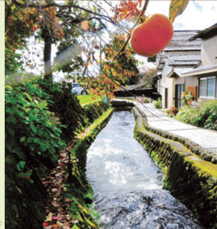
※疏水…灌漑(かんがい)・給水などのため土地を切り開いてつくった水路