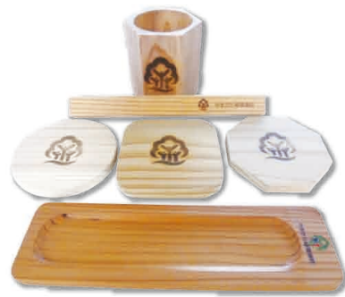
ペン立て・マグネット・コースター・ペン皿 「山形県間伐材製品セット」

★正解者の中から抽選で、「山形県間伐材製品セット」を、5名様に「ほほえみの宿 滝の湯 平日ペア無料宿泊券」を1名様にプレゼント!