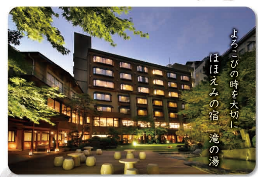
ほほえみの宿 滝の湯(天童市) 「ペア無料宿泊券(1泊2食付・平日限定)」

*当選者の発表は、商品の発送をもってかえさせていただきます。*応募いただいた個人情報は、「やまがた緑環境税」業務関係のみに使用します。*写真はイメージです。