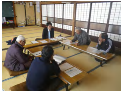
安全講習・意見交換

野生鳥獣と共存するため、地域住民と協働で下刈を行い、バッファゾーンを整備。また下刈の安全を確保するため下刈安全講習会も実施。