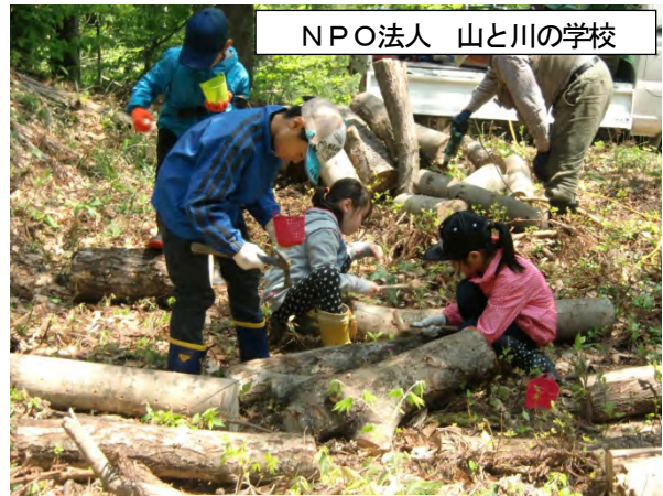
NPO法人 山と川の学校