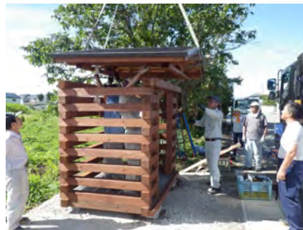
ゴミ集積施設の組立

の組み立てキットを製作し、住民と協働で組立・設置し、地域材の利用意義等の学習会を実施。