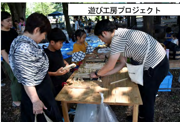
遊び工房プロジェクト