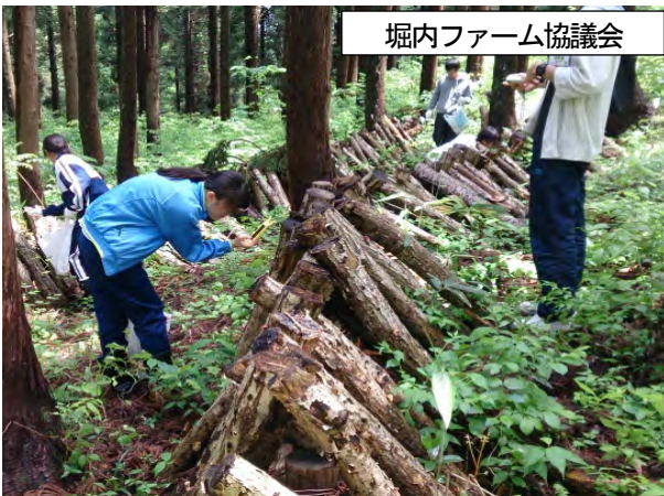
堀内ファーム協議会