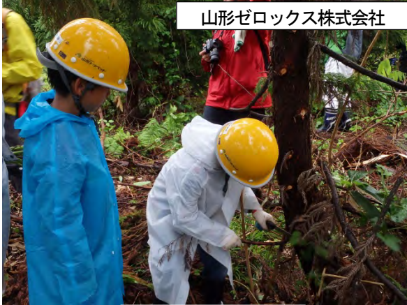
山形ゼロックス株式会社