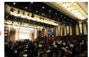
令和7年度カーボンニュートラルやまがた県民運動推進大会