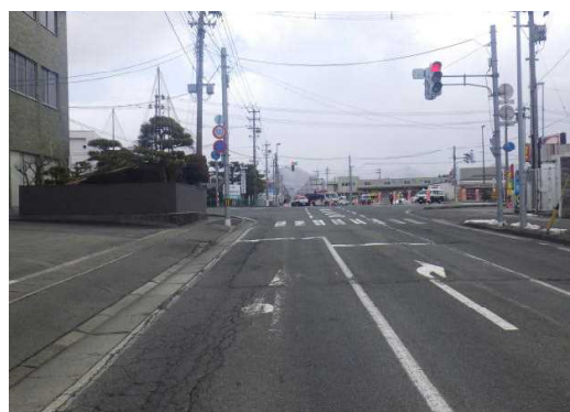
【Aから見た本件事故現場の状況】