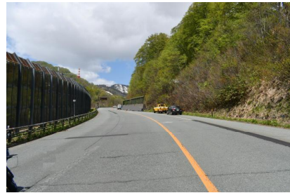
【Aから見た現場の状況】