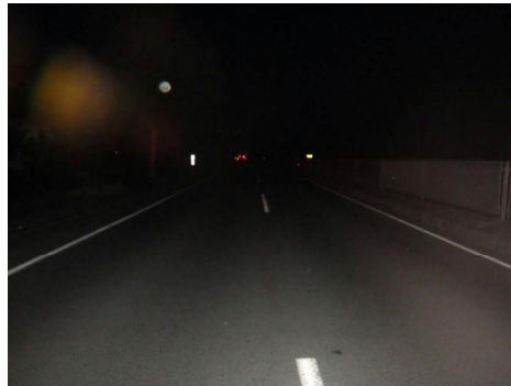
【Aから見た現場の状況】

過去5年(R3~R7)、第1当事者が二輪車(原付以上)の交通事故は159件！ うち重大事故(死亡・重傷)は6割以上の99件！