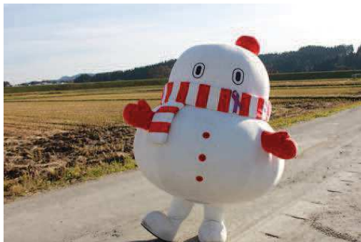
ご当地キャラクターのパープルリボンプロ ーチ着用の様子 (写真：(上) おおくら君 (大蔵町)、 (右) かねたん (米沢市)