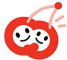
〔チェリアシンボルマーク〕

愛称である「チェリア」は、チェリー（さくらんぼ）とエリア（場所）の組合せによる造語です。さくらんぼは山形県の名産であり、また二つの実が一緒になっている形が男女仲良く並んで男女共同参画を表現しているように見えることからセンターのシンボルマークにもなっております。