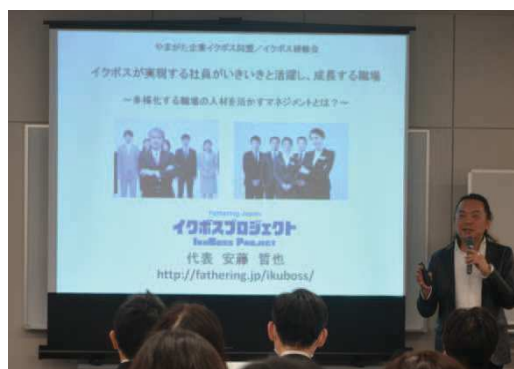
〔安藤代表による基調講演〕

研修会は、「イクボス」養成の第一人者であるNPO法人ファザーリング・ジャパンの代表理事 安藤哲也氏の