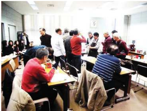
〔様々なコーヒーを飲み比べ、淹れ方や品種による味の違いを確認しています。〕

を發揮し、コーヒーを飲みながらのリラックスした雰囲気の中で講座が進み、最後は大いに盛り上がった話し合いとなり、皆さん何かしらの気づきがあった様子でした。