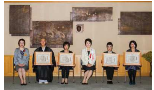
〔吉村知事及び子育て推進部長と受賞者〕

男女共同参画社会づくりに特に顕著な功績のあった個人若しくは団体又は仕事や地域活動等様々な分野でチャレンジし活躍している個人若しくは団体を顕彰し、その功績を称え、男女共同参画社会づくりに対する県民の一層の関心を高め、男女共同参画社会の形成の促進を図るため、「山形県男女共同参画社会づくり功労者等知事表彰」を実施しました。平成29年度は、功労者表彰2名、チャレンジ賞1名、1団体が受賞され、平成29年10月15日に開催された「チェリア・フェスティバル山形2017」において表彰式が執り行われました。