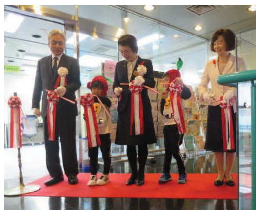
〔オープニングセレモニーの様子〕

この施設は、マザーズジョブサポート山形に続き開設したもので、結婚・出産・育児その他の理由で離職している女性の就職希望や仕事をしながらの子育ての不安等について相談に応じるなど、仕事と育児の両立に向けた支援を、山形労働局との連携のもと、一人ひとりのニーズに応じてワンストップで支援することにより、女性のさらなる就労促進を図ることを目的としています。