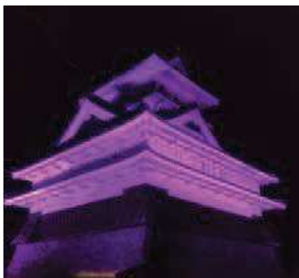
上山城のパープルライトアップ

ともに、会場にツリーを設置し、来場された皆さんからパープルリボンのオーナメントを飾って頂くことで、今回のパープルリボンプロジェクトのシンボルにしました。