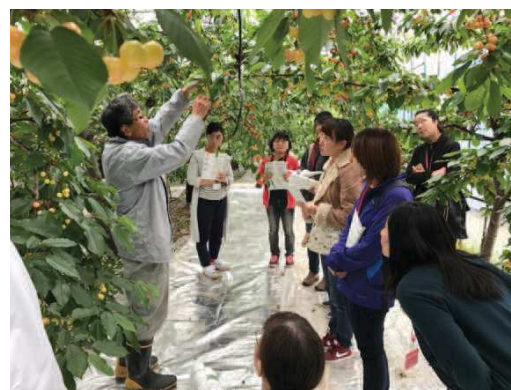
〔ママたちの職場見学会の様子〕

その他、県内 6 ヶ所のハローワーク等にマザーズ・コンシェルジュが出張し、セミナーの開催や個別相談に対応する「マザーズおしごと相談会」、就職面接用のスーツ、靴、バッグの貸出等も実施しているほか、当年度より、マザーズジョブサポート山形では、様々な業種に関心を持つきっかけとし、就業に関する女性の選択肢を広げることを目的として、「ママたちの職場見学会」を開催しております。