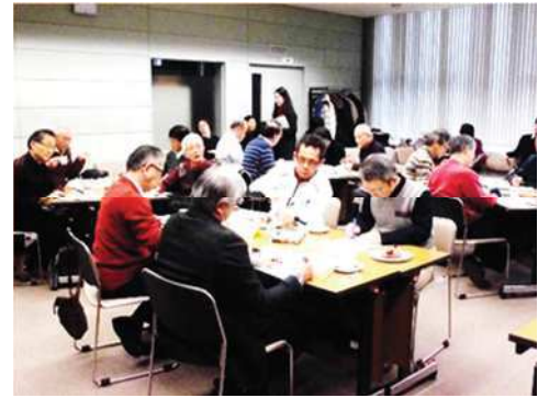
〔コーヒーを飲みながら、リラックスした雰囲気の中で話し合いが進みます。〕