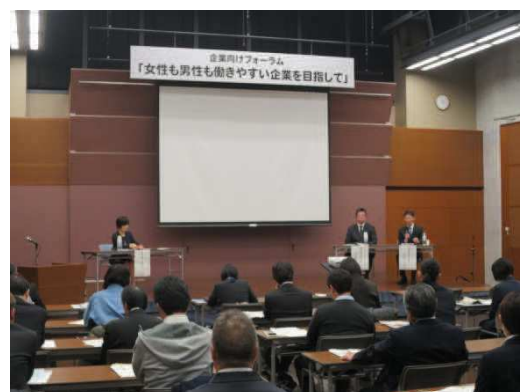
〔フォーラムの様子〕