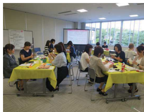
〔女性管理職養成プログラムの様子〕