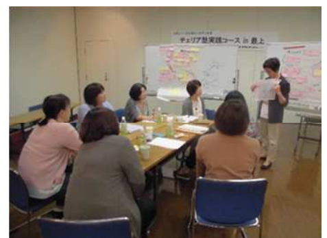
「実践コース」で自主企画講座のテーマを話し合っている様子

講座修了後は、今後自分達で自主的に活動していくグループ「もがみチェリア」を立ち上げ、最上地域に在住しているチェリア塾修了生にも声掛けし、地域の女性ネットワークの形成を目指していくことを確認しました。今後のご活躍を期待しています。