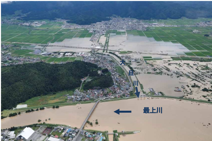
一級河川大旦川（令和2年7月浸水被害状況）

大旦川（村山市）において、河道改修と併せて計画目標相当の洪水を安全に流下させるため調節池を計画し抜本的な治水安全度の向上を図る。