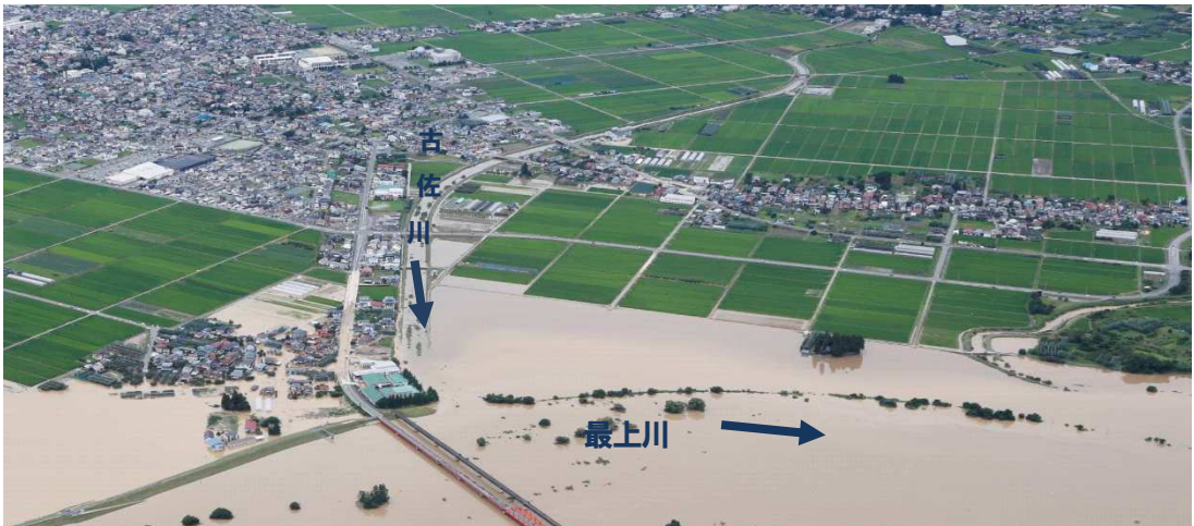
一級河川古佐川（令和2年7月浸水被害状況）