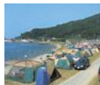
鼠ヶ関キャンプ場