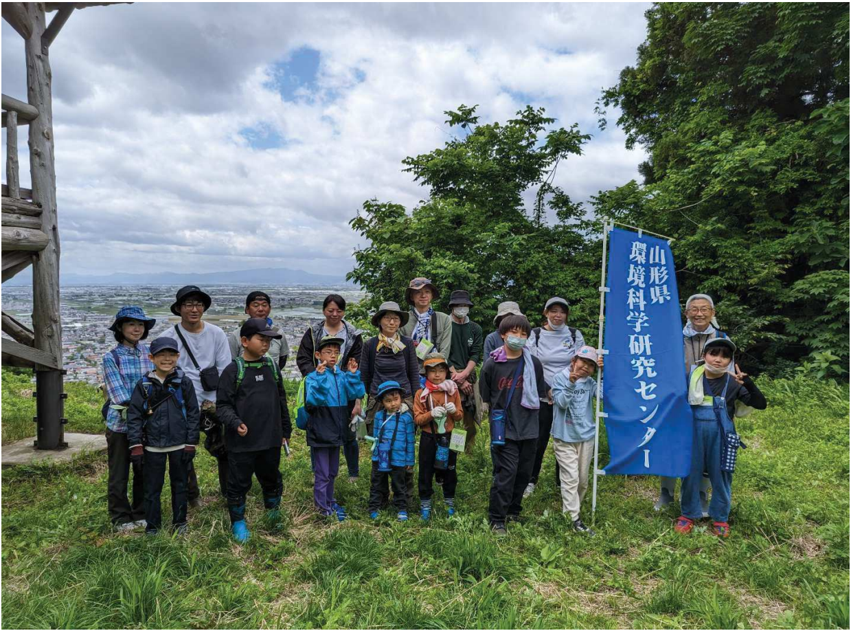
【令和5年度 親子で楽しむ環境科学体験デーの様子】 (6月3日(土) 自然観察会コース)