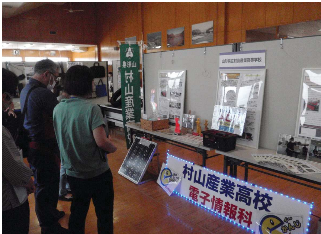
村山産業高等学校の展示