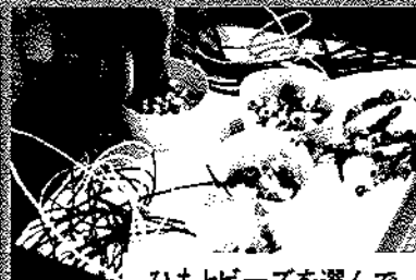
ひもとビーズを選んで