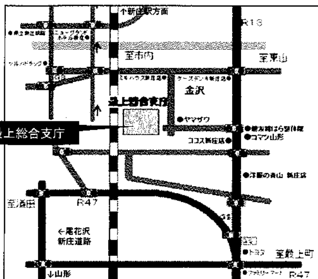
①最上会場:最上総合支庁 位置図

当日撮影する写真は、HPに掲載したり記録用資料として活用させていただいたりすることがありますので、御了承ください。