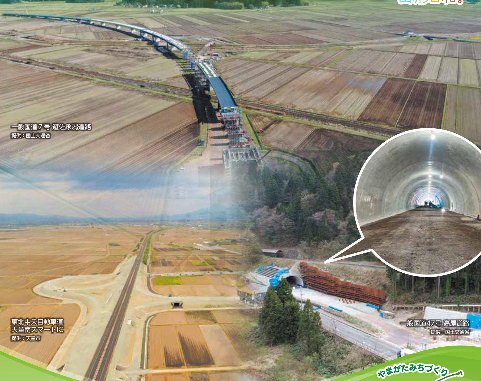
一般国道7号 遊佐象潟道路