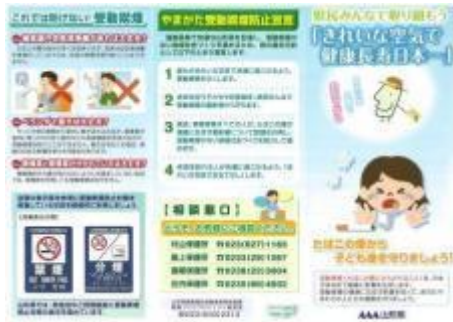
【県内幼稚園等への送付リーフレット】