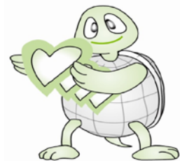
イメージキャラクター 「ウェルカム」

サービス事業として、事業所のホームページ作成サービスと求人サイトへの掲載（有料）、介護関連DVD及び図書の販売、賠償責任補償・傷害保険の案内、賛助会員の募集（事業者支援セミナー等の受講料減額、図書・DVDの割引、月刊誌の送付等）等も行っています。