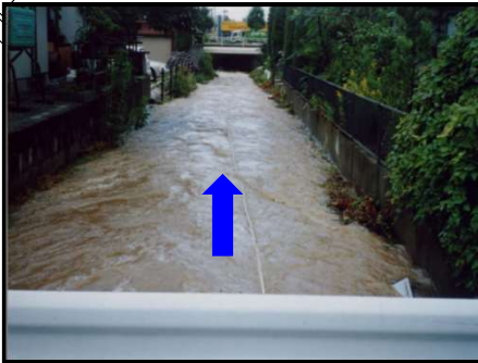
撮影箇所① (H14.7.11 台風6号)