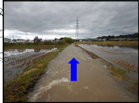
撮影箇所③ (R1.10.12 台風19号)