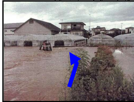
撮影箇所② (H14.7.11 台風6号)