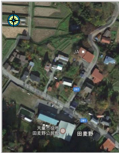
【保全対象詳細写真】