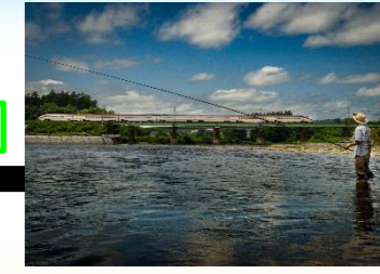
鉄道特別賞「つばさを見ながら」賞品（陸羽東線全27駅駅名プレート）