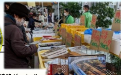
線路がつなぐ 石巻・庄内海鮮市