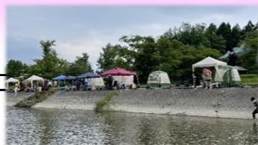
テントサウナ体験イベント（舟形町）