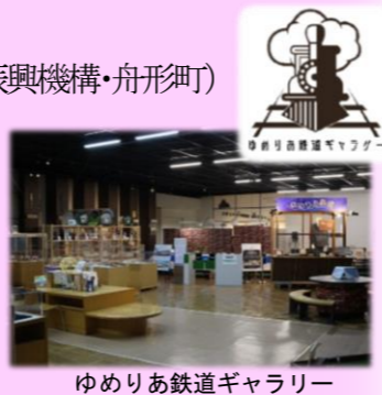
ゆめりあ鉄道ギャラリー