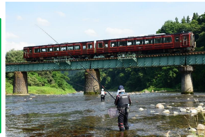
第8回最上小国川写真コンテスト 優秀賞 「静と動」