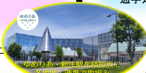
ゆめりあ・新庄駅を結節点に 各地域・連携で取組み