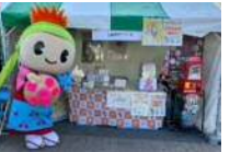
「青葉区民祭り」の様子(R5.11.13)