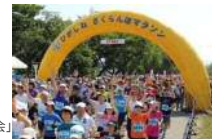
「さくらんぼマラソン大会」(R5.6.4)

【実施主体】 東根市、全国花笠マラソン大会運営委員会、大石田まつりを10倍楽しくする会