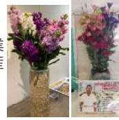
「地元産花きの展示(左:大石田駅、右:さくらんぼ東根駅)」