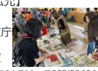
「やまがたえきまちなかマルシェ」でのPR(R5.10.14)