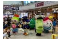
「やまがたえきまちなかマルシェ」(R5.10.14)