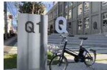
「山形コミュニティサイクル」

【関連】レンタサイクル事業 ・天童市観光物産協会(奥羽本線) ・寒河江市観光物産協会(左沢線)