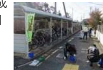
「天童駅周辺における美化活動」の様子