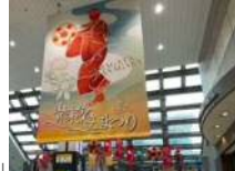
「山形花笠まつりの装飾(山形駅)」

【実施主体】 上山市外4団体、さくらんぼ東根駅観光物産振興協議会(東根市、河北町)、山形県花笠協議会