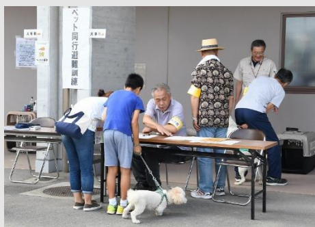
▲同行避難の訓練の様子（山形市）