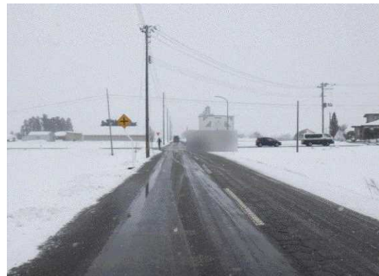
【Aの進路方向から見た現場の状況】