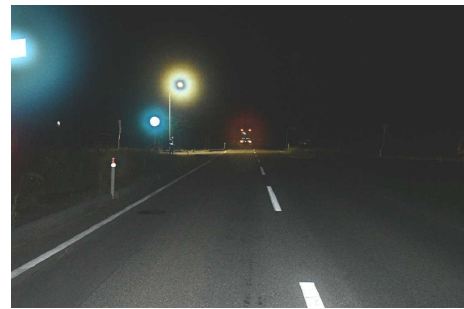
【Aの進行方向から見た現場の状況】